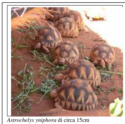
Astrochelys yniphora di circa 15cm

Le prime due specie è risaputo che sono ormai a fortissimo rischio di estinzione, ma anche per le Pyxis planicauda ormai la situazione è veramente difficile e pure per le Astrochelys radiata che in realtà il loro areale di distribuzione non è in questa zona ma nel sud dell'isola, ci dicono gli amici del centro Sokake, che negli ultimi 10 anni il numero in natura è diminuito fortemente, circa del 90%). Erymnochelys madagascariensis , unica tartaruga endemica d'acqua dolce del Madagascar, è inserita nel "RED BOOK" della IUCN tra le 25 specie a maggior rischio di estinzione, sono allevati diversi esemplari con un ottimo risultato riproduttivo.