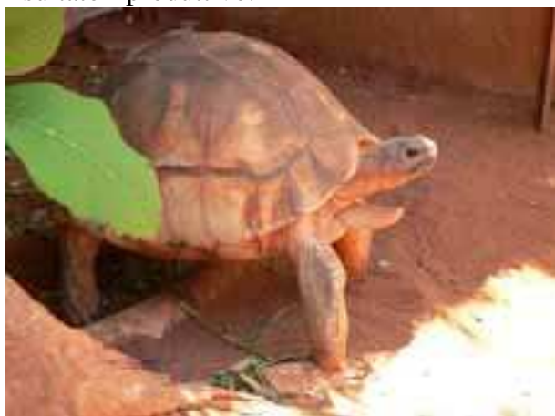
Esemplare adulto di Astrochelys yniphora