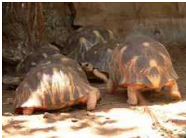
Adulti di Astrochelys radiata

Obiettivo della visita al Parco è stato anche verificare la possibilità di instaurare un rapporto di collaborazione orientato a migliorare le attività di recupero, allevamento e riproduzione del “Project Angonoka”.