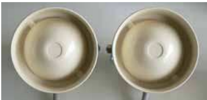
Le 2 sirene elettroniche