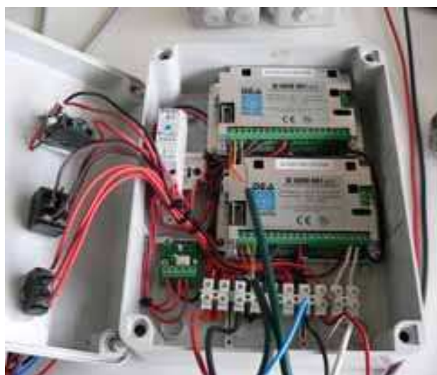
Interno della centralina elettronica

Alcuni materiali, come la batteria da 100Ampere, alcuni cavi elettrici, la lamiera e le guaine da sotterrare, saranno acquistati a Mahajanga per via del peso e ovvie difficoltà nel trasporto.