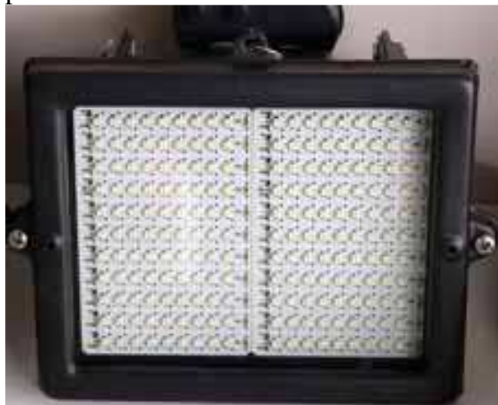
Uno dei 4 proiettori a LED

Inoltre, abbiamo compreso l'installazione di 4 proiettori a Led, a basso consumo, che in caso di allarme, illuminano tutta la recinzione anche se con luce non molto forte, ma sufficiente per vedere se vi è la presenza di qualche intruso; inoltre i fari possono essere utili anche per verifiche notturne non necessariamente con allarme attivato. Sia le sirene che i proiettori sono installati su un palo in posizione centrale della recinzione.