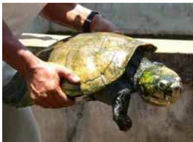
Esemplare adulto di Erymnochelys madagascariensis

La stima del numero di Astrochelys yniphora rimaste in Madagascar è di circa 600 esemplari suddivisi in circa 400 in natura e 200 nel centro.