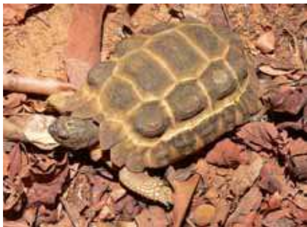
Adulto di Pyxis planicauda

L'incubazione delle uova nel centro è del tutto ancora naturale (ben 12 mesi) e non vengono utilizzate incubatrici. La percentuale di schiusa è sul 60%.