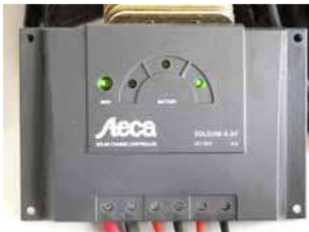
Regolatore di carica

Tutto il sistema è stato testato in Italia per due mesi, anche in condizioni di scarso soleggiamento, dando ottimi risultati.