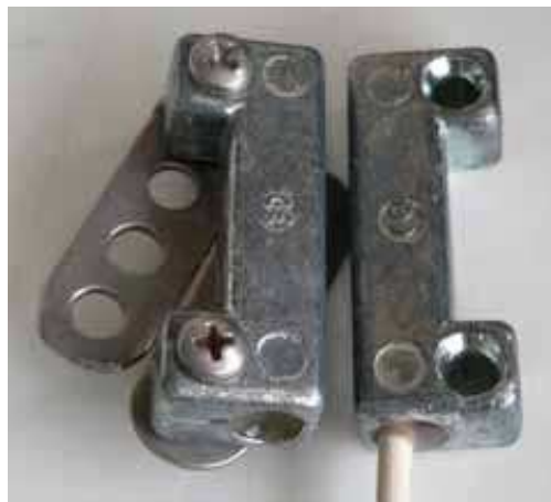
Il contatto magnetico

Oltre al sistema di sicurezza, il TCI ha deciso di donare i seguenti materiali: