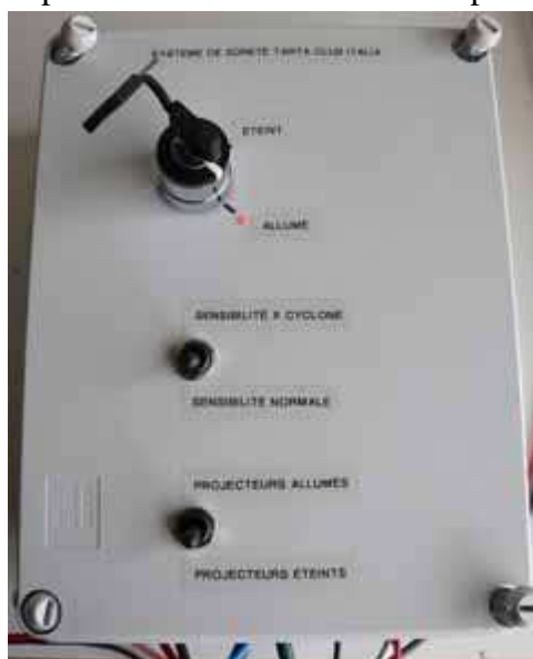
Esterno della centralina elettronica